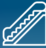
SCORRIMANO, RINGHIERE, PUNTI DI APPOGGIO