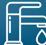
PORTE, RUBINETTI E DISPENSER