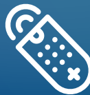
TELECOMANDI, TELEFONI COMPUTER EQUIPMENT, POS