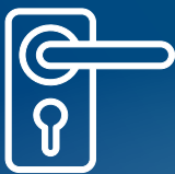
MANIGLIE E ARREDI