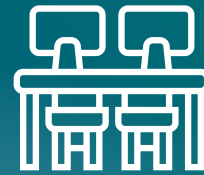
SUPERFICI DI LAVORO