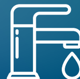
PORTE, RUBINETTI E DISPENSER