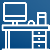
TAVOLI, SEDIE, ATTREZZATURE PER UFFICIO E TASTIERE